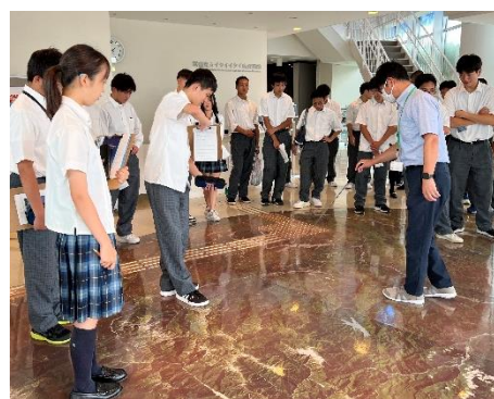
エントランスホールで説明を受ける (床は富山県の地図)