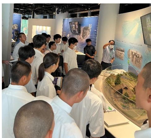
神通川の水を使っでの平和な暮らしが・・・