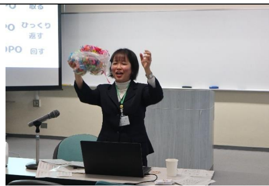
ブラジルのお守り