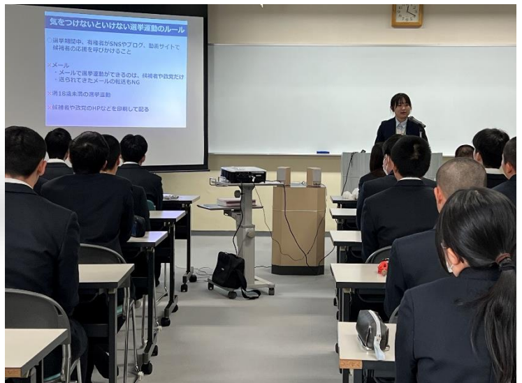
「満18歳未満の選挙運動は禁止」という選挙のルールを教わりました