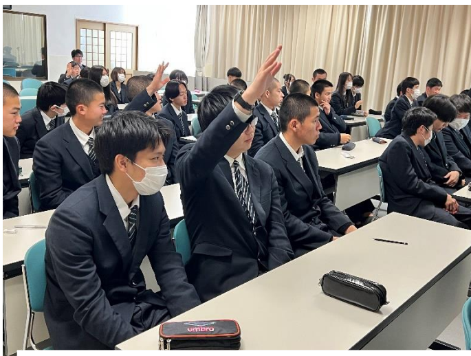
【選挙クイズ】投票用紙にある秘密とは？（三択です）