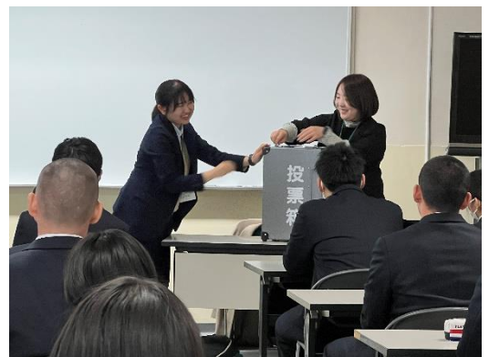
投票所に一番に来た人は、投票箱に何も入っていないことを確認しなければならない『零（ゼロ）票確認』