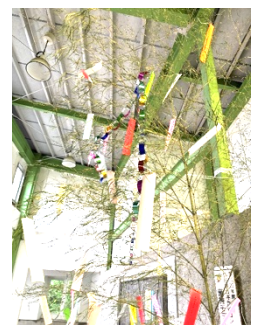
【完成した七夕飾り】