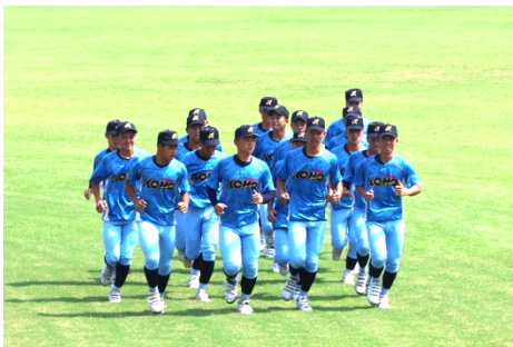
【ウォーミングアップ】