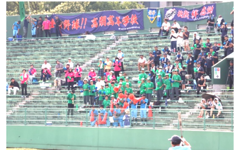
【スタンドからの応援】