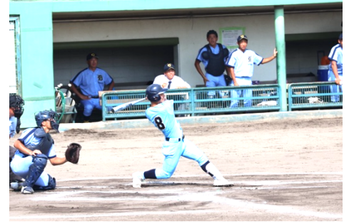
【1番 磯淵選手のホームラン】