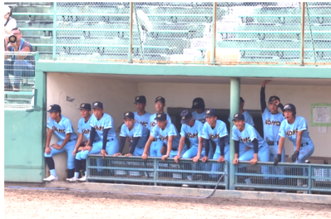
【ベンチからの声援】