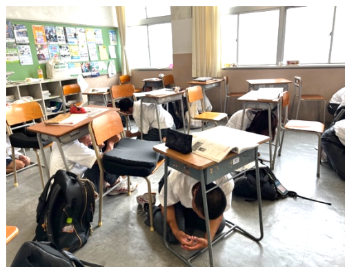
【「しゃがんで」「隠れて」「じっとして」】