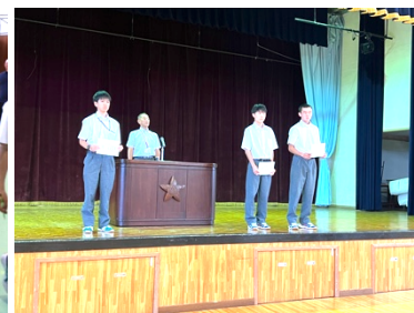
【認証式での会長と副会長】